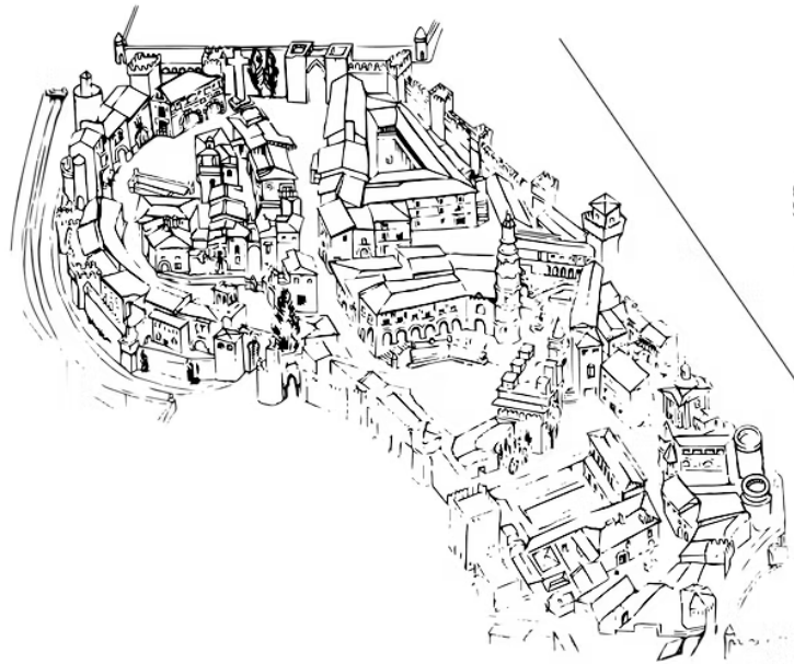
PE PUEBLO ESPAÑOL

El Congreso de Paraplejía 2026 tendrá lugar en el Pueblo Español de Mallorca y su Palacio de Congresos. Entre sus plazas y calles, los asistentes disfrutarán de ponencias, talleres, comunicaciones y los actos de inauguración y clausura.